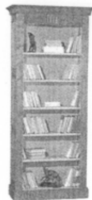
Regal Stendhal im Landhausstil aus Erie im Kirschholztönen ge beizt, innen gestrichen.